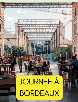
JOURNÉE À BORDEAUX