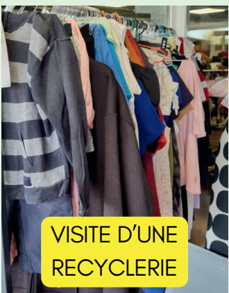
VISITE D'UNE RECYCLERIE